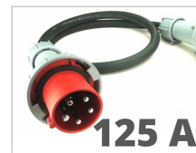
Elektrische kabel 125A