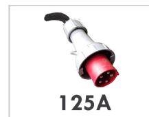
Elektrische aansluiting 125A