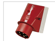
Electrische aansluiting 125A