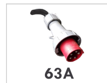
Elektrische aansluiting 63A