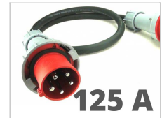
Elektrische kabel 125A