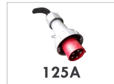
Elektrische aansluiting 125A