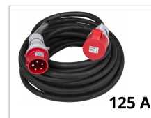
Elektrisches Kabel 125A