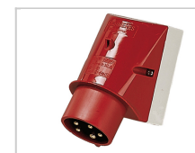
Elektrischer Anschluss 125A