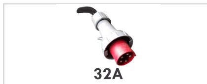
32A Elektrischer Anschluss