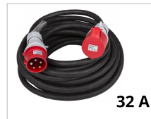
Elektrischer Anschluss 32A