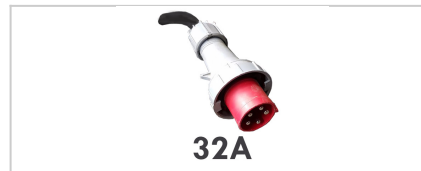
32A Elektrischer Anschluss