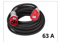
elektrisches Kabel 63A