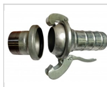
2" Bauer Anschluss