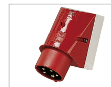
Elektrischer Anschluss 125A