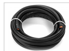
185mm 2 Verlängerungskabel