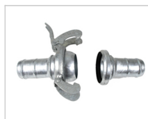
4" Bauer Anschluss