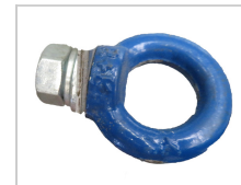
Anneau de suspension