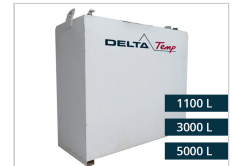
Réservoir de diesel