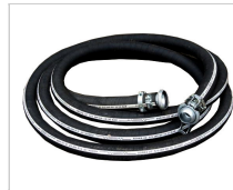
2" tuyau d'eau