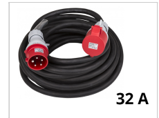
Cable électrique 32A