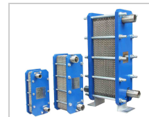
Échangeur de chaleur