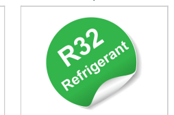
Gaz réfrigérant R32