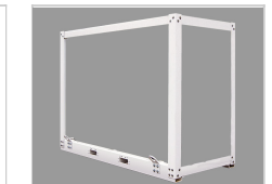
Cadre de protection