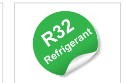
Gaz réfrigérant R32