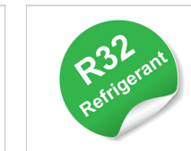
Gaz réfrigérant R32