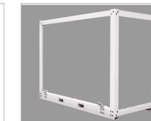
Cadre de protection