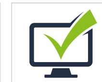
Surveillance à distance