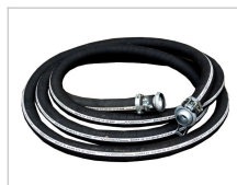
2" tuyau d'eau