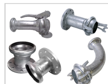
2" connecteurs Bauer