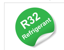
Gaz réfrigérant R32