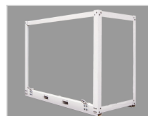
Cadre de protection